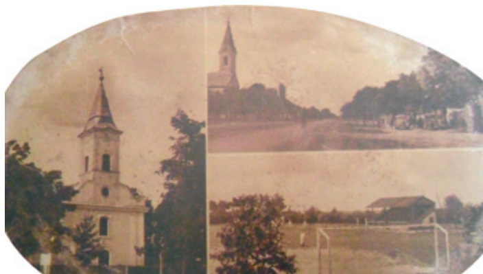
Képeslap 1929-ből, a református templom átépítés előtti állapotával

» 1881. Szakértő kéményseprő fogadtatik fel a tűzveszély elhárítására. Évente hat-