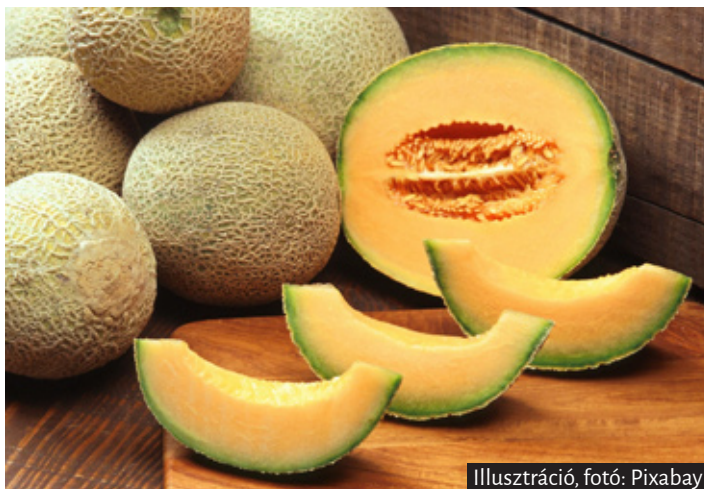
Illusztráció, fotó: Pixabay

2015-ben először próbáltunk dinnyetermesztéssel. A térségi összefogással és külön támogatással Kunágótán is folyamatban lévő Pilot programban fóliás sárgadinnye termesztés folyik 10 fóliásátorban.