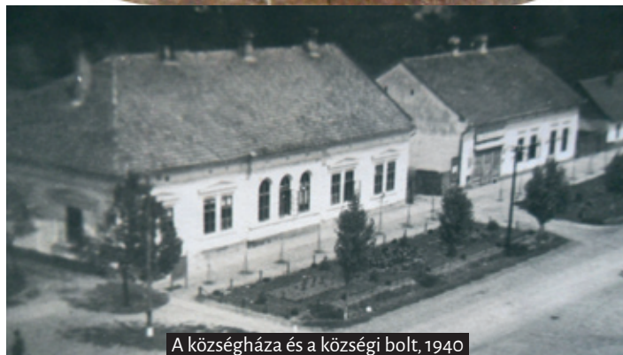
A községháza és a községi bolt, 1940

szor a községben és a pusztaiaknál minden kéményt átseper, és a rendetlenséget jelenti a hivatalnak.